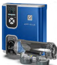
eXO® iQ LS