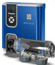
eXO® iQ LS