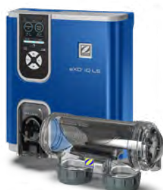
eXO® iQ LS