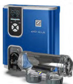
eXO® iQ LS