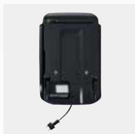
Station de charge et de rangement