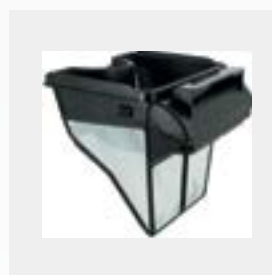
Bac filtrant de 100 µ