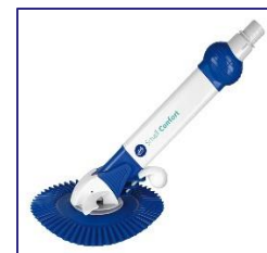
Nettoyeurs automatiques Automatische zwembadreiniger