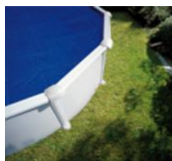
CPROV1020 Bâche isotherme Isothermische afdekking