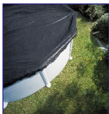
CIPROV1001 Bâche d'hiver Winterafdekking